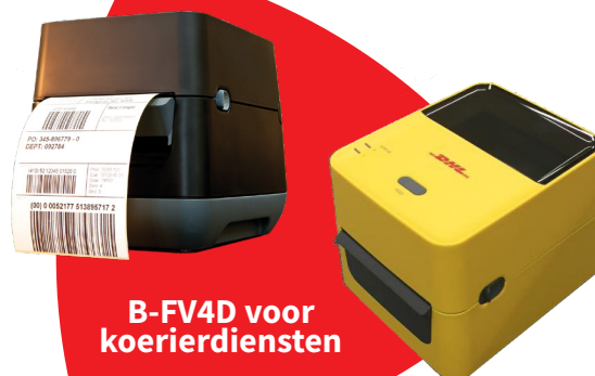
B-FV4D voor koerierdiensten

Speciaal voor koerierdiensten heeft Toshiba B-FV4 -toestellen ontwikkeld waarmee je in een handomdraai allerlei verzendetiketten kan printen. Het couriermodel heeft een standaard ingebouwde 'peel-off'-module waardoor je gemakkelijk en snel je etiket kan afnemen. Bij het linerless-model kunnen compacte etiketrollen zonder rugpapier gebruikt worden waardoor je geen afval produceert. Door de standaard ingebouwde snijmodule worden de labels volledig doorgesneden en krijg je op maat afgewerkte etiketten. Speciaal voor DHL werd het toestel in een ander kleurtje gegoten en gepersonaliseerd met logo.